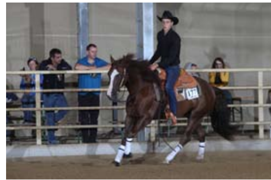
David Perus/SLO & Slide Lena Chic